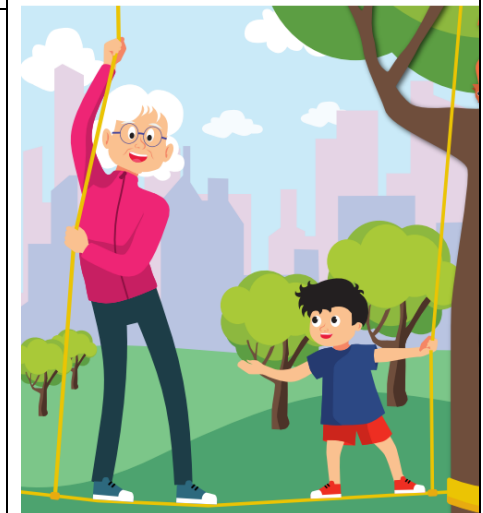
V lanových centrech se mohou bavit různé věkové skupiny, ale s přihlédnutím k rizikům a také k osobní zodpovědnosti každého uživatele.