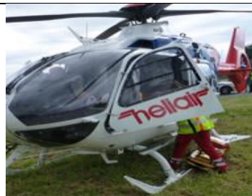
Zdroj: idnes, 12. listopadu 2018

Třináctiletý hoch se v neděli odpoledne vážně zranil ve Štramberku na Novojičínku. Nejspíše při pádu z branky při hře si těžce poranil hlavu, záchranáři dokonce nevyloučují poškození mozku.