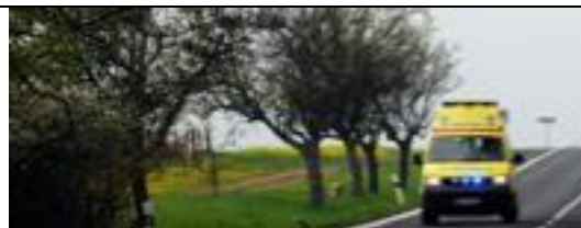
Zdroj: Novinky.cz, 6. srpna 2019

Moravskoslezští záchranáři zasahovali v úterý dopoledne u vážně zraněného dítěte na Novojičínku. Osmiletý chlapec se zranil v lanovém centru v Trojanovicích u Frenštátu pod Radhoštěm, informoval mluvčí moravskoslezských záchranářů Lukáš Humpl.