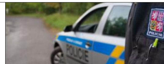
Zdroj: Novinky.cz, 22. července 2019

„Svědci okamžitě zareagovali, když přistavili žebřík a přidržovali dívku, aby se sevření lan uvolnilo. Další muž přeručkoval k dívce a tam odřízl lana. Z místa ji transportovala záchranná služba již při vědomí,“ doplnila Ladmanová.