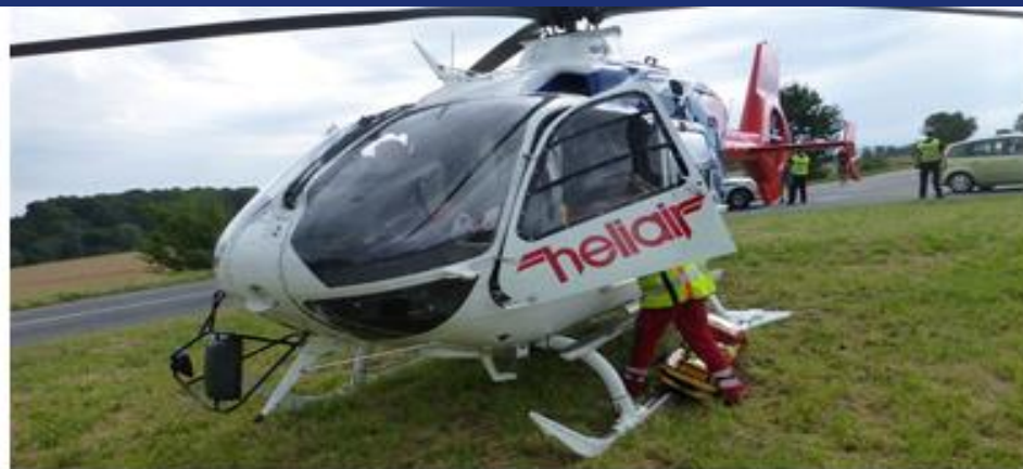
(ilustrační snímek) | foto: ZZS MSK

Třináctiletý hoch se v neděli odpoledne vážně zranil. Nejspíše při pádu z branky při hře si těžce poranil hlavu a nevyločují poškození mozku.