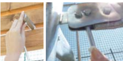
Obr.: Měření rizika zachycení prstů

tovních veřejně přístupných zařízení je v návaznosti na zákon č. 40/1964 Sb., Občanského zákoníku nepochybně osobou, která je povinna zajistit bezpečný provoz. Tuto zodpovědnost rozdělujeme do dvou rovin – a to na i. odpovědnost za škodu, tedy majetkoprávní odpovědnost (kterou lze pojistit) a ii. trestněprávní (kterou samozřejmě pojistit nelze). c. Více viz http://www.overenehriste.cz/dokumenty/odpovednost-za-provoz.php ;