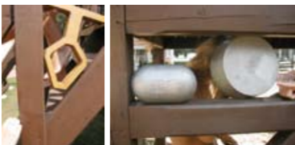
Obr.: Měření rizika uchycení krku-hlavy