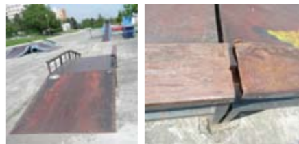
Obr.: Nebezpečný skateboarding

herních či sportovních prvků (kde nelze provést opravu či úpravu); f. Dozor dospělé osoby – při hře i sportu; g. Jak doložit splnění preventivních opatření na bezpečný provoz hřiště? Značkou OVĚŘENÝ PROVOZ.